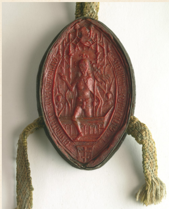
Pieczęć bożogrobca – kadr z filmu O chrześcijańskich korzeniach Polski

Bożego, czego widocznym śladem jest wykorzystanie symbolu podwójnego krzyża w ich heraldyce – oznaczające również, że ukształtowana we wczesnym średniowieczu tradycja jest żywa do dziś.